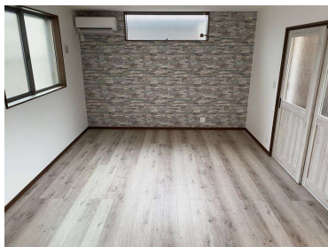
リビング 室内(2024年2月)撮影 洋風なリビング空間