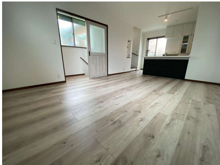
リビング 室内(2024年2月)撮影 広々とした明るい空間